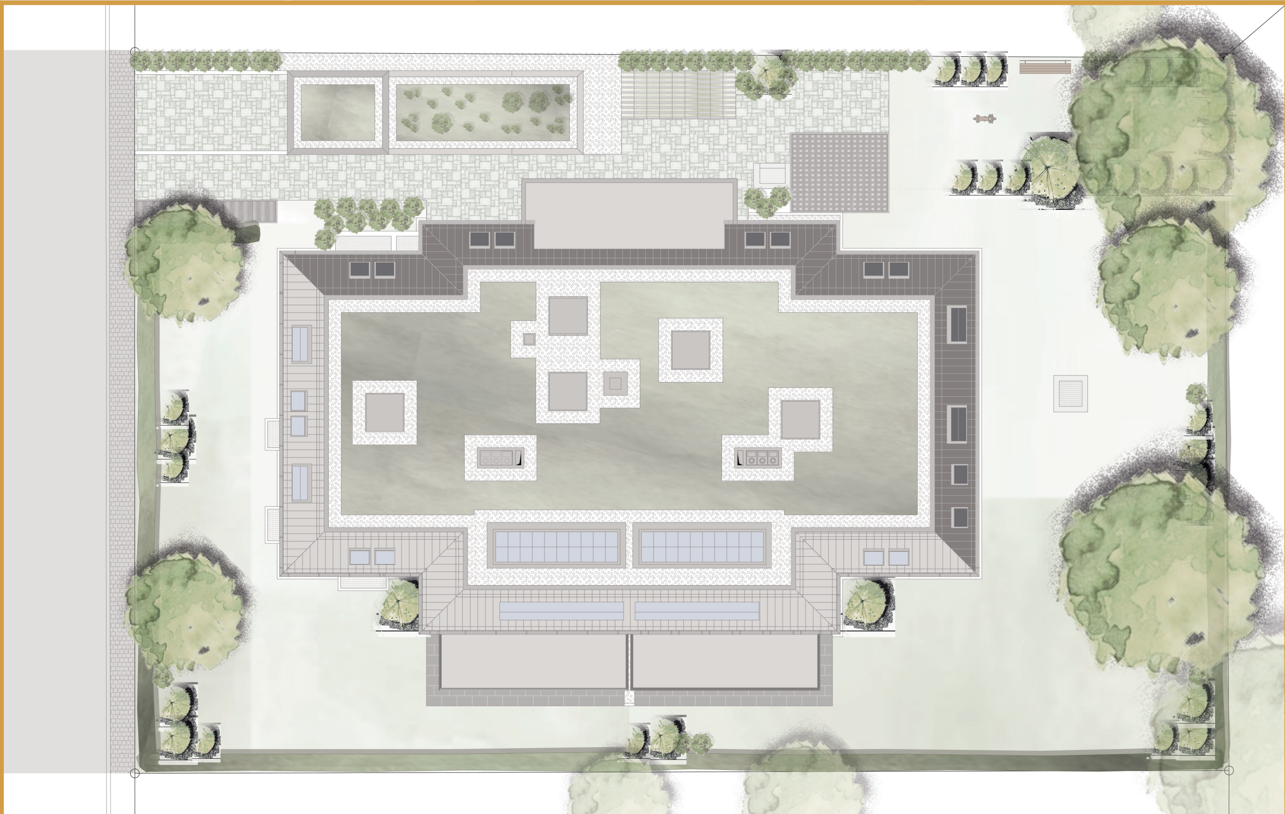
Aufsicht Haus (vergrößerte Darstellung)

von hier sind es 1,3 km zur Bavarian International School