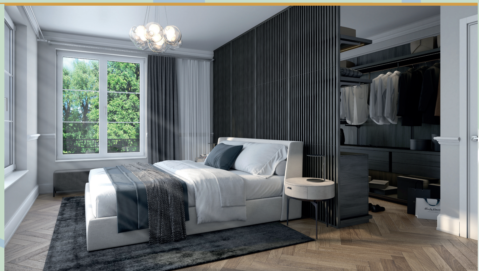
Ruhig und entspannt Schlafen, gut erholt in den Tag starten und dann ins Büro, zum Sport in den Englischen Garten oder zum nahegelegenen Bäcker spazieren. All das bietet Ihnen ihr neues luxuriöses Zuhause.