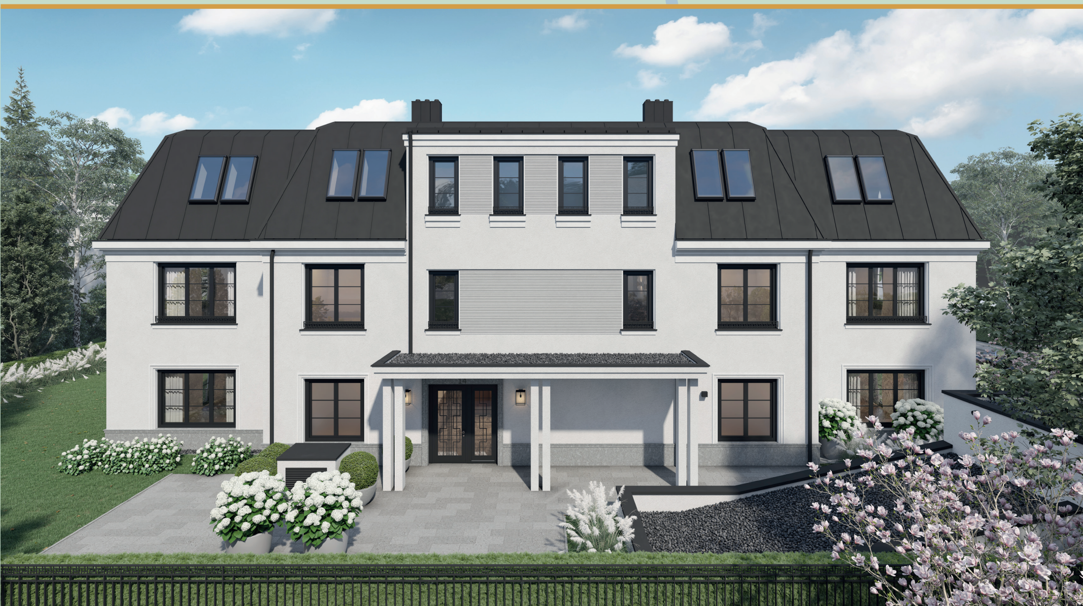
Willkommen in Ihrem neuen Zuhause. Die Hermann Vogel Straße 14 ist von allen Seiten ein echter Hingucker. Edle Architektur und Fassadengestaltung, hochwertigste Materialien und eine Lage wie Sie nur noch selten zu finden ist. Fünf exklusive, luxuriöse Wohneinheiten in ruhiger, grüner Lage mit viel Privatsphäre.