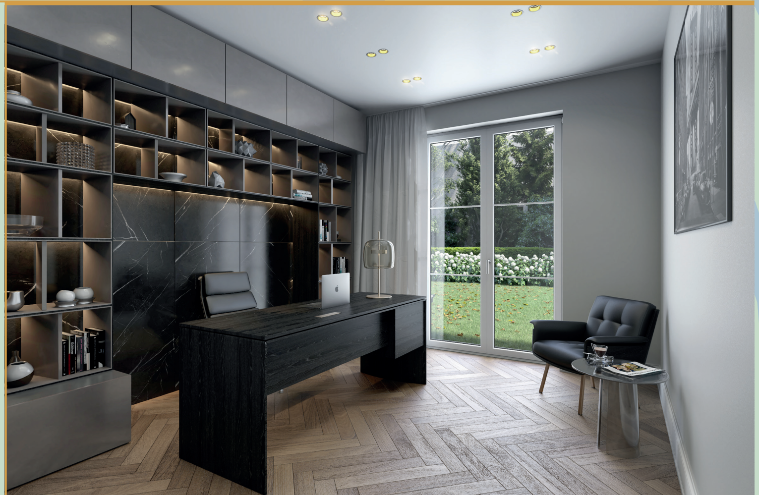
Arbeiten in luxuriösem Ambiente mit Blick ins Grüne. Für eine entspannte Arbeitsatmosphäre bietet ihr neues Zuhause allen Komfort.